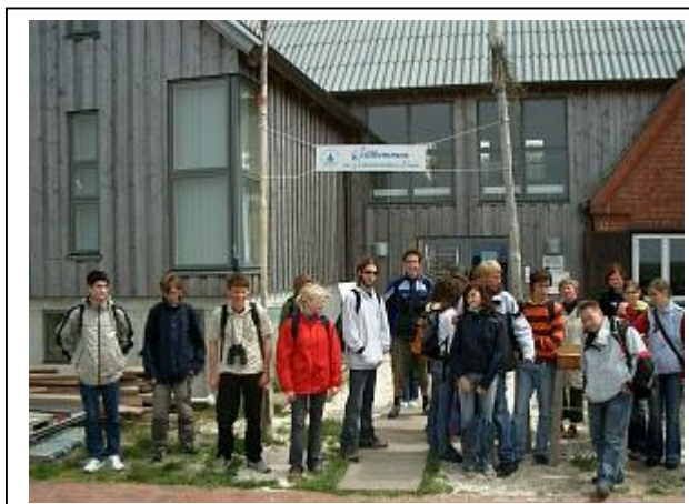
die 10a und die Comenius-AG

So hoffen wir nun auf ein neues Projekt im Rahmen des Comenius-Programms, damit durch diese Erfahrungen die Jugendlichen der verschiedenen europäischen Nationen sich besser kennenlernen können.